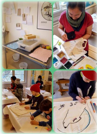
Skoletjeneste aktivitet, okt.2020.