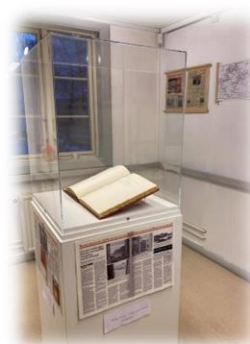
Udstillingen af Gæstebog, Dec.2020.